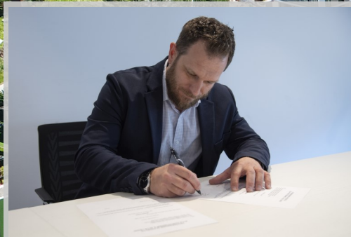
Corrado Chiesa Municipale (voti 660)

Dicasteri: Traffico, Sicurezza pubblica, Salute pubblica e Economia pubblica