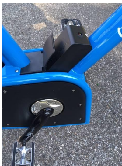
(alloggiamento nella bicicletta)

Gli utenti con l'abbonamento annuale ebike con batteria personale, riceveranno al momento della stipulazione dell'abbonamento una batteria (vedi foto) grazie alla quale, inserita nell'apposito alloggiamento, permetterà di beneficiare della prima mezz'ora gratuita di ogni utilizzo anche per le ebike. Questo permette di salvaguardare le batterie principali presenti nella ebike, consentendo una loro gestione più razionale ed efficiente.