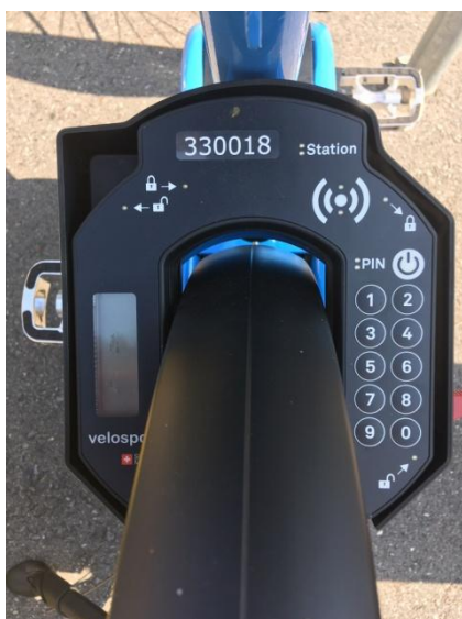
(lucchetto elettronico V. 3.0)

L'Applicazione Velospot 2.0, utilizzabile e scaricabile sia per iOS che per Android, permette di avere una visione d'insieme delle postazioni e del numero di biciclette stazionate in modo da poter verificare sempre la disponibilità ed il tipo di biciclette presenti.